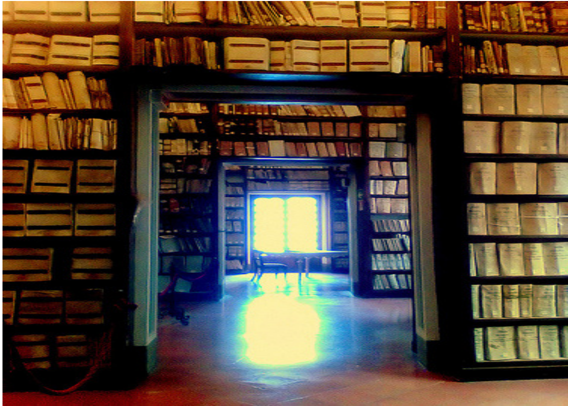
Βιβλιοθήκη Πατριαρχείου Αλεξανδρείας