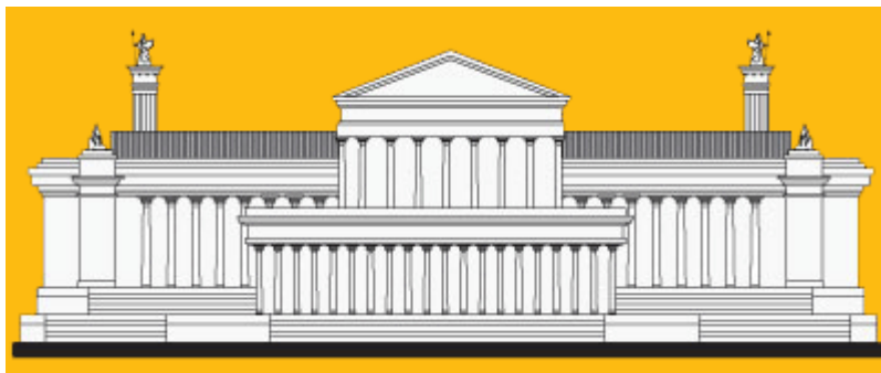
Παλαιά Βιβλιοθήκη της Αλεξάνδρειας