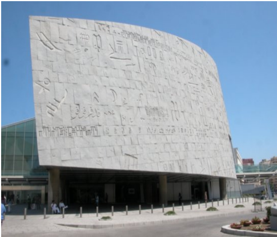
Νέα Βιβλιοθήκη της Αλεξάνδρειας