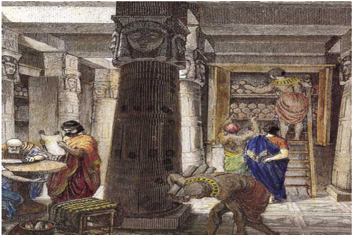
Παλαιά Βιβλιοθήκη Αλεξανδρείας